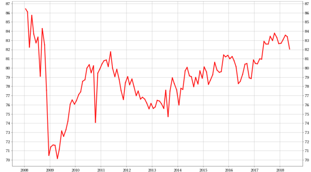
— Industrie chimique, taux moyen d'utilisation des capacités de production (CVS) (en pourcent)